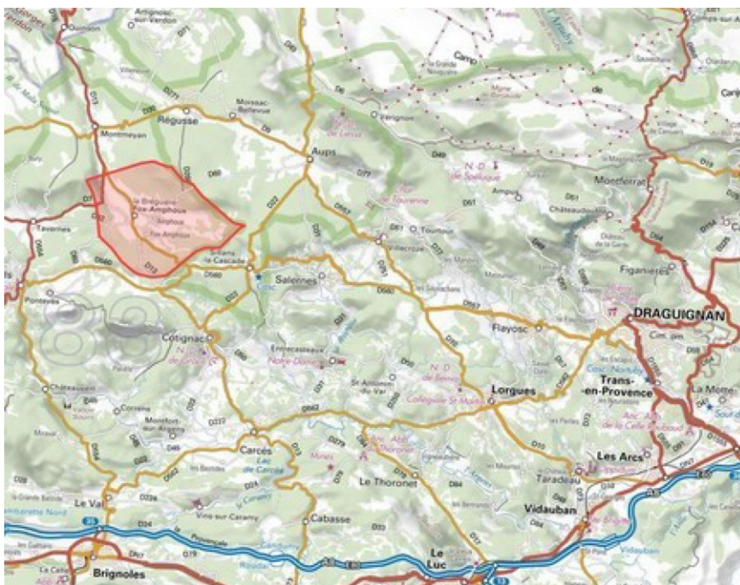
Figure 1: Plan de situation de la commune

Encadrée par des reliefs boisés, la commune est caractérisée par un paysage agricole le long des routes départementales qui parcourent le fond de vallée de la Bresque 2 . Le village ancien de Fox occupe une situation perchée caractéristique.